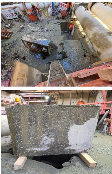
Im mittleren Bereich der Baugrube (Block 2) werden die Abbrucharbeiten der Decke mittels Sägeschnitten durchgeführt. Sobald ein Betonklotz ausgesägt worden ist, wird dieser aus dem Loch gehoben und anschließend mit Hebebändern auf das Baufeld Ost gehoben. Dort wird der Betonklotz dann zeitnah für den Abtransport zerkleinert.