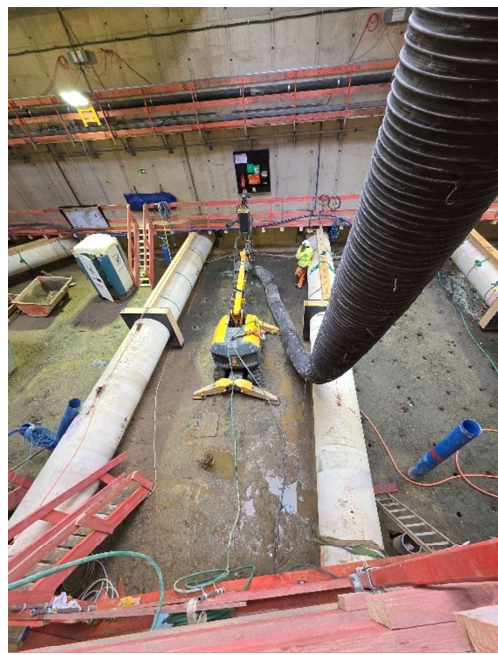
Die Abbrucharbeiten werden in allen Bereichen des Gleiswechsels mit verschiedenen Geräten durchgeführt. Die beengten Verhältnisse erschweren die Arbeiten.