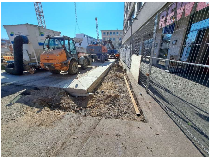
Im Norden des Baufeldes laufen bereits seit vergangener Woche die erforderlichen Erdarbeiten zur Herstellung eines neuen Radweges.